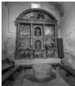
Sant Fruitós d'Iravals