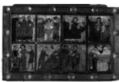
Frontal de Saga. Musée des Arts Décoratifs Paris