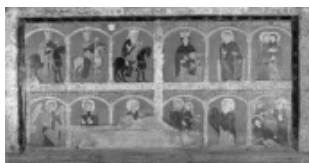
Frontal de Mosoll. MNAC

El cerdà demana també al frontal un paper pedagògic, útil. El de Mosoll ens narra el naixement de Jesús, l'Anunciació, l'Adoració dels Mags, però també les proves del misteri de l'Encarnació amb la Visitació i l'encontre amb Simeó. El de Saga ens dona tots els detalls de la vida de santa Eugènia. Encara una vegada ens trobem enfront d'una vista més propera a la realitat tangible que no pas a la imaginació.