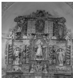
Retaule de sant Martí d'Ilix

L'èxit de la reforma protestant fa por a Roma que reuneix el concili de Trento per contestar al perill. L'art barroc neix de la voluntat papal de provar la victòria catòlica sobre el protestantisme. El retaule barroc s'oposa a les afirmacions protestants i dóna molta importància als sants, a la Mare de Déu, a l'Eucaristia. Ocupa la totalitat de l'espai arquitectural per dir que el catolicisme no deixa ni el més petit espai als altres cristianismes. Tota la Cerdanya adopta aquesta expressió artística i una proliferació de retaules envaeix el nostre territori. El segle XVIII és un moment de prosperitat econòmica a la nostra comarca i una part del diner guanyat es dirigeix cap a l'ostentació religiosa, sempre de qualitat i de bon gust. Només a Càldegues hi ha sis retaules barrocs. Una església tan petita com la de Bajanda en vol un. Dues obres mestres dominen el paisatge cerdà, el retaule de la Mare de Déu de Font-romeu de Josep Sunyer a l'inici del segle XVIII i el retaule de sant Sadurn d'Enveig a la segona meitat del segle, a punt d'arribar a la Revolució Francesa.