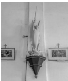
A les Escaldes, podem verificar la franquista a sant Domènec de Puigcerdà pujada dels feixismes amb aquesta glorificació de la victòria

Després de la victòria dels nacionals , el Santiago Matamoros, un sant espanyol, s'instal·la a Guils de Cerdanya on el moro té una bandera roja tot i que, a Catalunya, preferim des de sempre sant Jaume pelegrí.