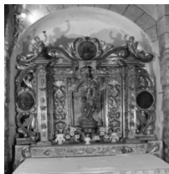
Retaule del Rosari de Càldegues