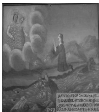
Exvot de Font-romeu