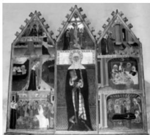
Santa Marta d'Iravals