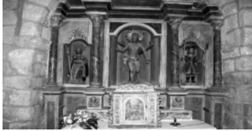
Retaula neoclàssic d'Estavar. 1829

Fins a la Revolució Francesa, quasi tota la Cerdanya viu en una conformitat de sentiments religiosos. No es contesta gaire la veritat de la religió catòlica. Cada diumenge cada un participa al sant sacrifici com una obligació acceptada. Després de 1789, els cerdans no participen a l'iconoclasme anticlerical revolucionari però el pateixen per exemple a Err on una devota salva la marededéu. La unitat es desagrega.