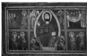
Frontal de Guils. Museo del Prado

El cerdà demana també al frontal un paper pedagògic, útil. El de Mosoll ens narra el naixement de Jesús, l'Anunciació, l'Adoració dels Mags, però també les proves del misteri de l'Encarnació amb la Visitació i l'encontre amb Simeó. El de Saga ens dona tots els detalls de la vida de santa Eugènia. Encara una vegada ens trobem enfront d'una vista més propera a la realitat tangible que no pas a la imaginació.