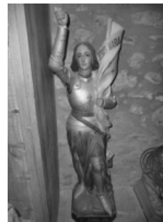
Sants més francesos a l'alta Cerdanya: El saint curé d'Ars regalat el 1943, sainte Thérèse de l'Enfant Jésus i sainte Jeanne d'Arc