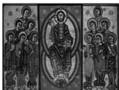
Frontal de la Seu d'Urgell. MNAC